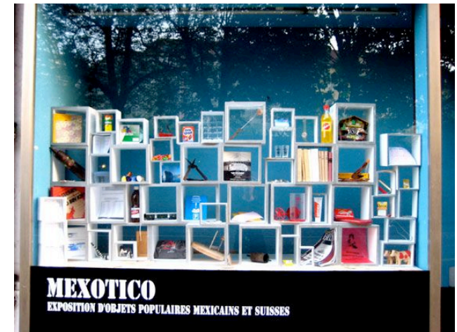
.....Annexe exposition "Mexotico" 2/2