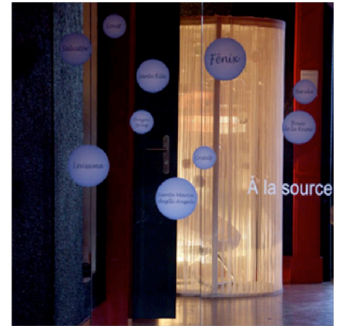
.....Annexe exposition "L'eau en bouteille, entre contenant et contenu" 3/3